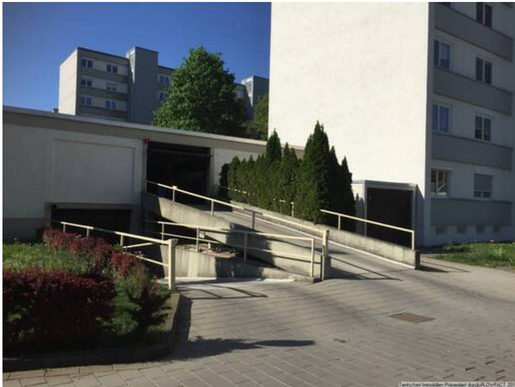
Zufahrt Tiefgarage 2