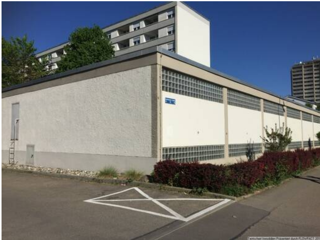
Rückseite Tiefgarage 2