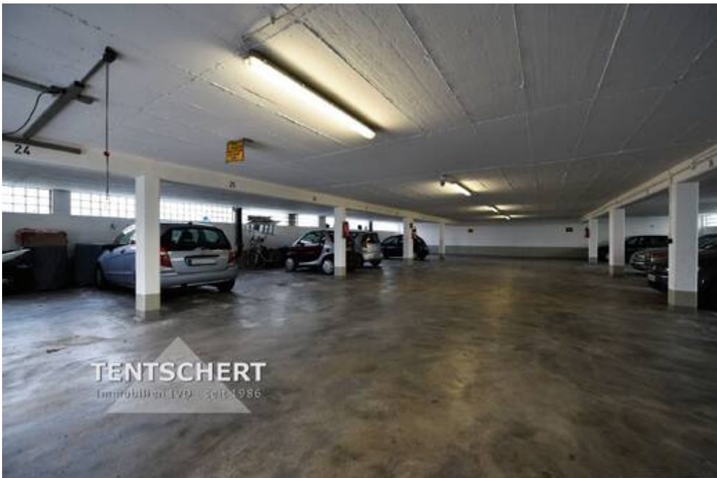
Innenaufnahme TG 1